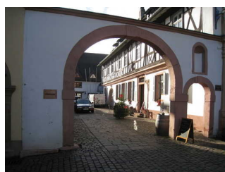
Weg vom Parkplatz zur Vinothek