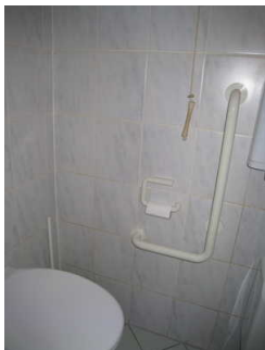
Haltegriff rechts und Alarmauslöser