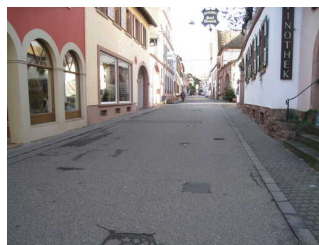
Weg vom Parkplatz zur Vinothek