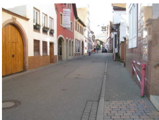
Weg vom Parkplatz zur Vinothek