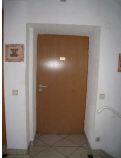
Tür Öffentliches WC