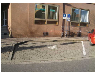
Parkplatz an der Ecke Schulstraße/ Marktstraße